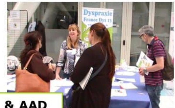
Les stands DFD & AAD